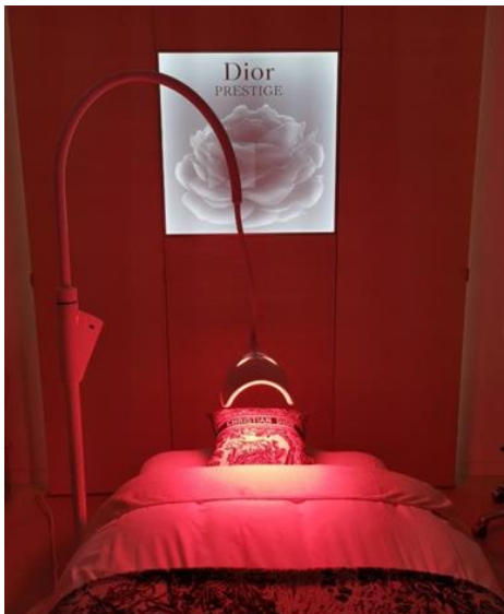
Prototype fonctionnel du masque OVE dans l'une des deux versions professionnelles, installé depuis le 1 er octobre 2022 dans le SPA DIOR, Hôtel Cheval Blanc – Paris

Dans certains marchés, DIOR proposera également à ses clients la version BtoC du masque OVE dans ses boutiques et sur son site internet. Les premières livraisons des masques de beauté OVE à DIOR dans le cadre de ce partenariat interviendront dès le 4 ème trimestre 2022.