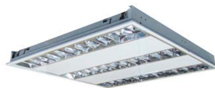
T3LED Luminaire LED encastré Basse Luminance