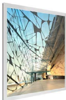
Lucidream Dalle LED sérigraphiée