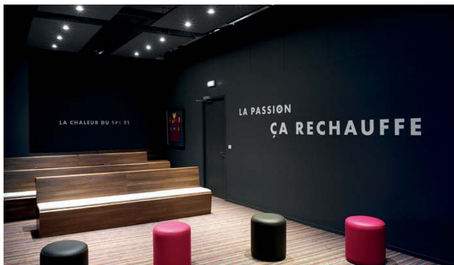
Casino Joa, Montrond-les-Bains (France)