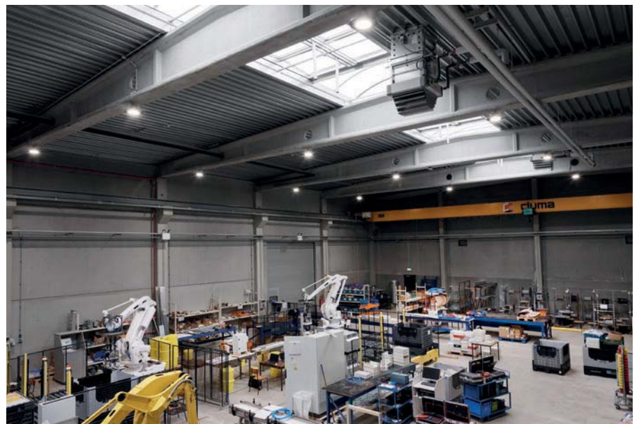
Intrion, Huizingen (Belgique)