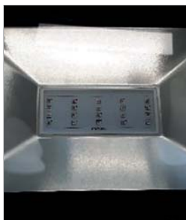
Vue des LED Ambre