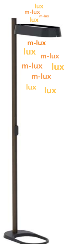
Luminaire anthracite + bois avec abat-jour anthracite