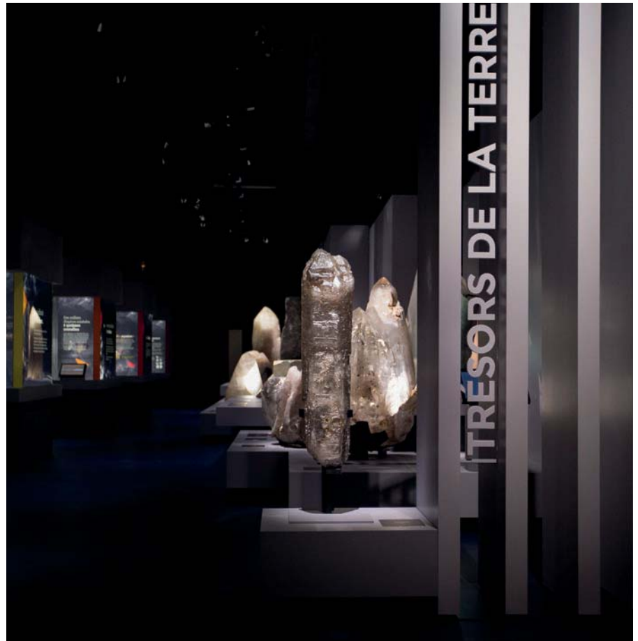
Exposition «Trésors de la Terre» - MNHN, Paris (France) ©Augustin de Valence, Scénographie : MAW

Eclairage d'œuvres d'art, en volume (statues, sculptures,...) ou murales (peintures, photographies,...)