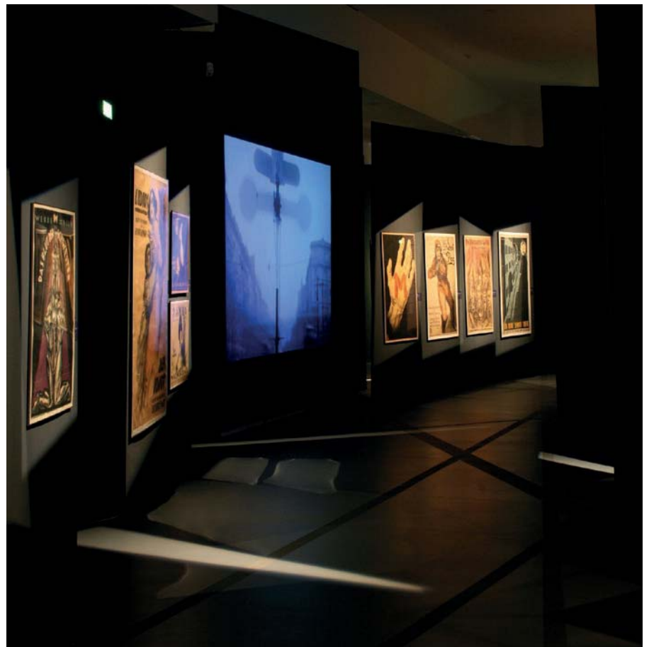
Cinéma française, Paris (France)

Eclairage d'œuvres d'art murales (peintures, photographies, tapisseries, esquisses...) avec possibilité de les cadrer.