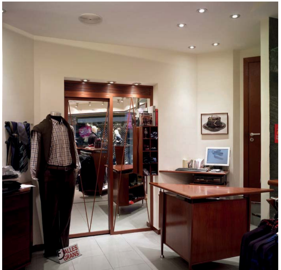
Can Fajol, Figueres (Espagne)