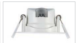
Capot Transparent pour le Blanc Neutre 4000K