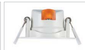
Capot Orange pour le Blanc Chaud 3000K