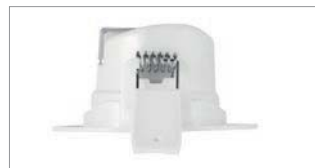
Montage sans outil : connecteurs à poussoir et capot de protection clipsable