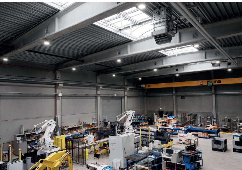
Intrion, Huizingen (Belgique)