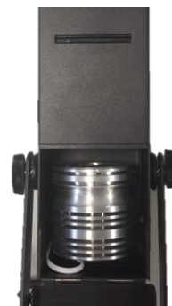
Projecteur avec bloc LED

Lorsque l'opération de conversion a été effectuée, le client a ensuite la possibilité de changer par lui-même, sans outillage et avec une grande facilité, le bloc LED pour modifier la couleur d'éclairage selon ses besoins artistiques.