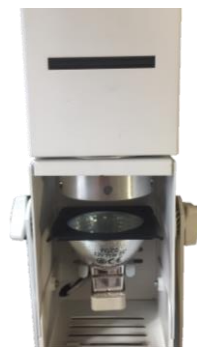
Projecteur avec ampoule

Cette prouesse technologique repose sur un système ingénieux de remplacement de l'ampoule ancienne génération par un bloc LED en aluminium fabriqué par Procédés Hallier dans son usine, permettant ainsi de conserver tout le corps du luminaire.